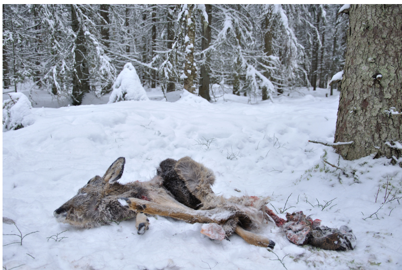
Loslaget rådjur sydost Rödjan.